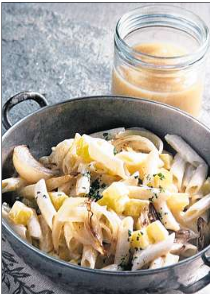
Macarùns dad alp.