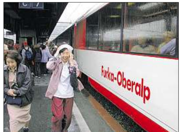
Ils trens da la Viafier retica e da la Matterhorn Gottard circuleschan tut l'onn tras il tunnel.

(lq) L'Unfrenda da curaisma da l'onn 2006 ha nudà entradas da bunamain 23 milliuns francs. Quai è passa in milliun dapli che l'onn avant. La concentraziun sin 16 projects cun temas centrals haja chaschunà il surpli d'entradas.